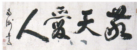
英雄、 魂のメッセージ