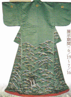
凛とした気品！篤姫の着物