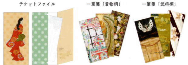
※写真はイメージです。実際のデザインとは異なる可能性があります。

本展特製のオリジナルチケットファイル・一筆箋(いずれも非売品)と、観覧券1枚のセットです。菱川師宣筆「見返り美人図」を配したチケットファイルに、3種類の絵柄の一筆箋が5枚ずつ入っています。一筆箋の絵柄は、本展に出品される江戸・昭和時代のきものや帯をあしらった色鮮やかな「着物柄」と、信長・秀吉・家康の衣装をあしらった「武将柄」からご購入時にお選びいただけます。