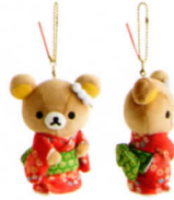
©2019 San-X Co., Ltd. All Rights Reserved. ※写真はイメージです。実際のデザインとは異なる可能性があります。

販売価格：3,200円(税込) 販売期間：2020年1月15日(水)~4月13日(月) (月) 販売場所：ローソンチケット、チケットぴあ、セブンチケット、イープラス ※ぶらさげぬいぐるみのサイズは約13×10cm。 ※リラックマぶらさげぬいぐるみは、本展会場特設ショップでも販売予定です(数に限りがあります)。